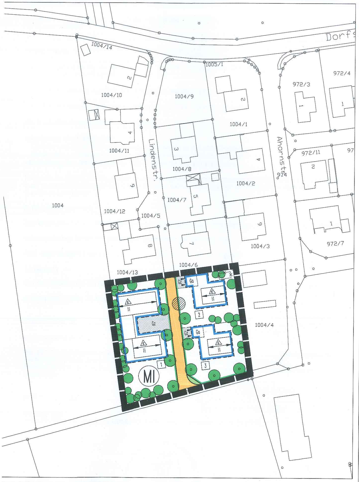
Anlage 2 Auszug aus dem Bebauungsplan "Dornwang-West Erweiterung"